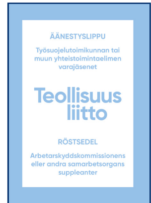
Työsuojelelutoimikunnan tai muun yhteistoimintaelin varajäsenten vaali