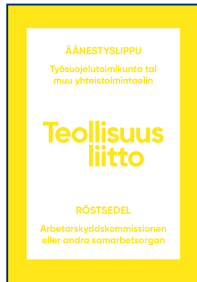
Työsuojelelutoimikunnan tai muun yhteistoimintaelin vaali