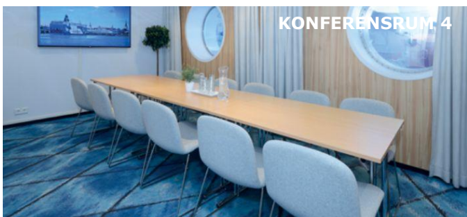
Konferensrum för 12 personer. Kan sammanslås med rum 5 till ett utrymme för 32 personer.