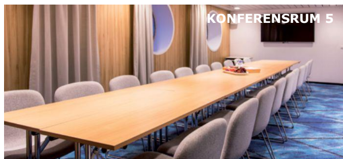
Konferensrum för 20 personer. Kan sammanslås med rum 4 till ett utrymme för 32 personer.