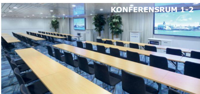
Två 50 personers konferensrum. Rummen går att förena till ett utrymme för cirka 110 personer.